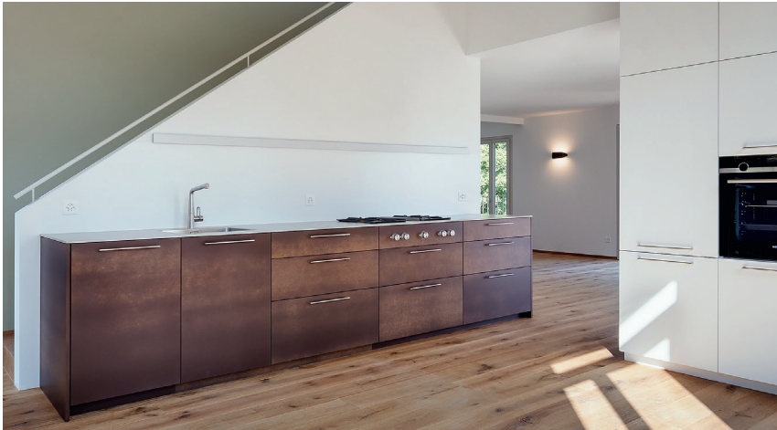
Küchenfronten: HPL 0.9 mm Naturfaser 909 TS tectr Schränke: HPL 0.9 mm 306 TS tectr