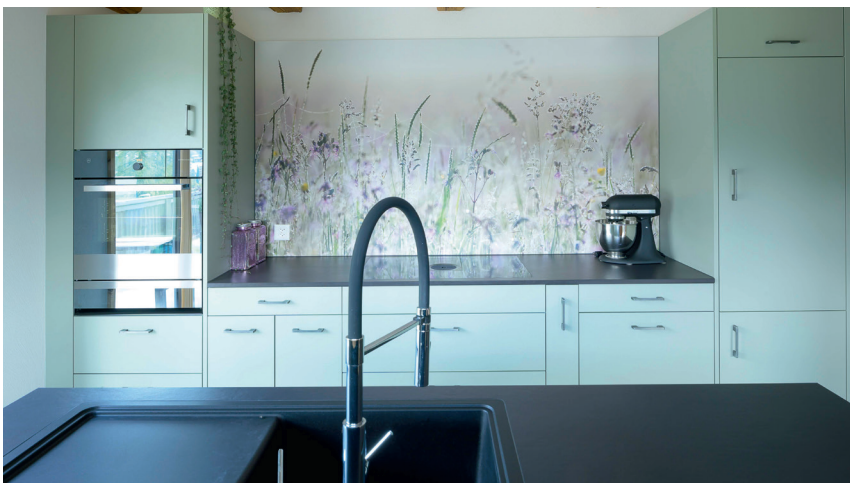
Rückwand: Argoprint «Morning Melody» AM 8 mm Kompakt Plus Küchenfronten: 14 LA Argoplax

Echte Fotokunst in den eigenen vier Wänden. Auch in dieser Küche wurde Individualität gross geschrieben. Küchenrückwand mit HPL Kompakt Plus und einem Motiv aus der «Argoprint»-Linie der Kollektion HPL BOX und passendem HPL Unidekor. Designstark, robust und langlebig. Auch Funktionen wie magnethaftend sind bereits ab einer Platte frei zum Design kombinierbar.